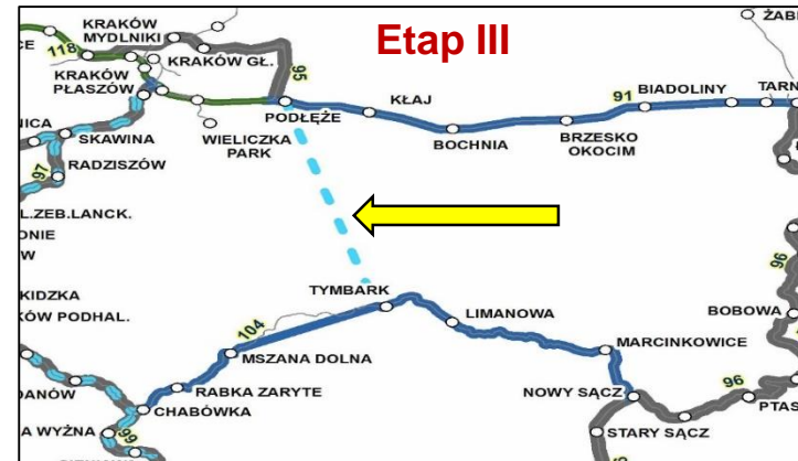
Etap III budowa nowej linii kolejowej Podłęże-Szczyrzyc-Tymbark/Mszana Dolna