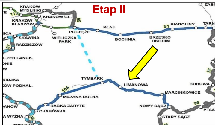
Etap II modernizacja linii kolejowej nr. 104