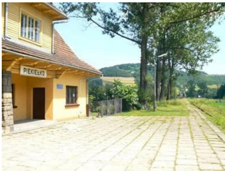
Przystanek osobowy Piekiełko na linii nr. 104