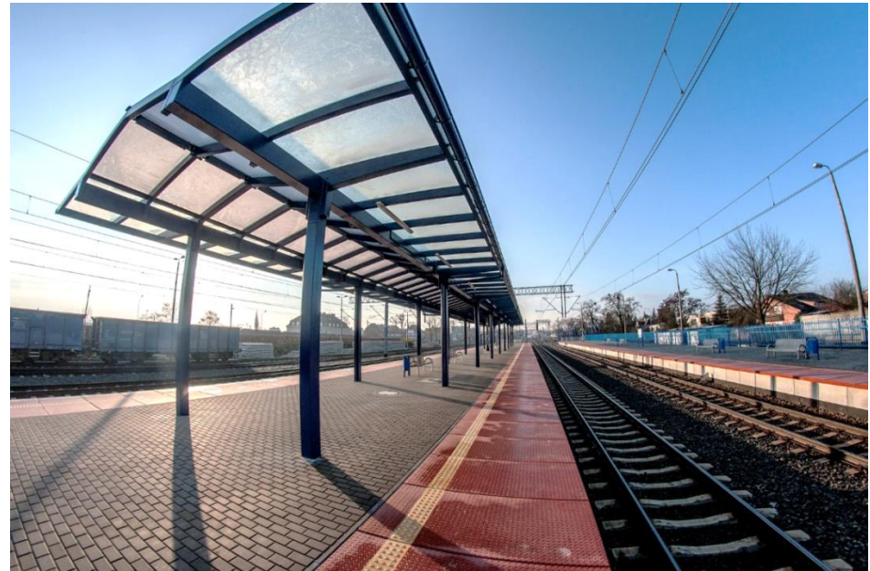
Nowa infrastruktura peronowa na stacji kolejowej